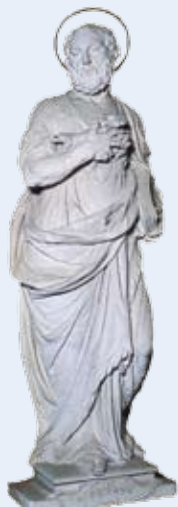
■ San Pietro

Giovanni Bonazza (1654-1736) le "statue"