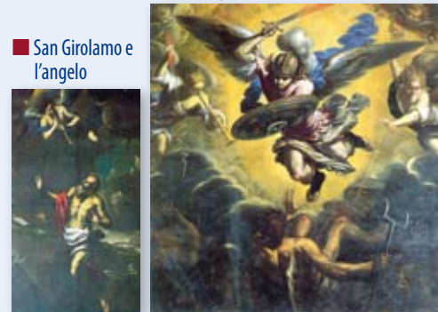
■ San Girolamo e l'angelo