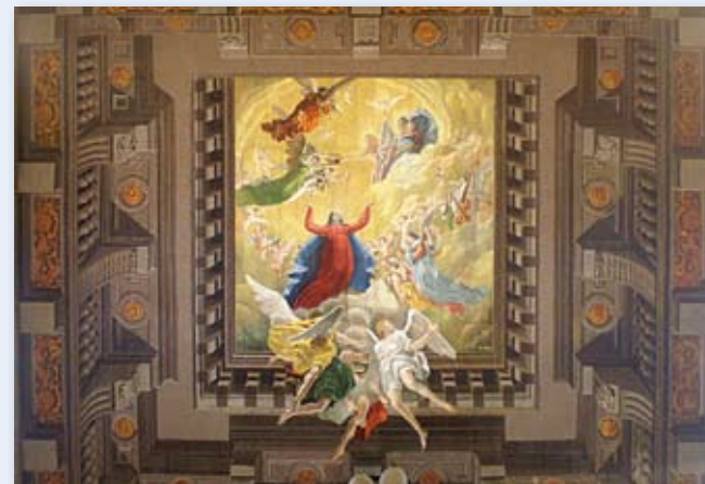
■ Soffitto del coro

Quadrature prospettiche a finte architetture opera del 1620 del bresciano Tommaso Sandrini con scene centrali ridipinte da Demetrio Alpago nel 1902.