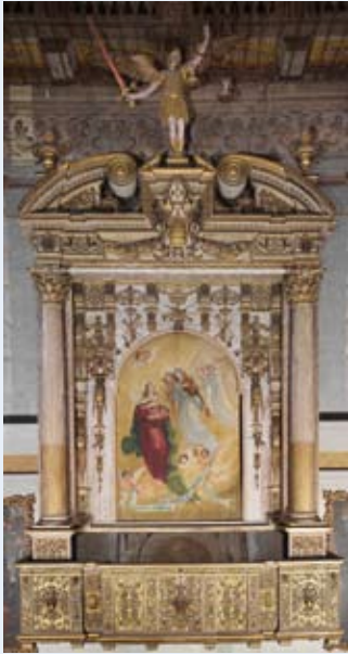
■ Cassa d'organo, Costanzo Antegnati.