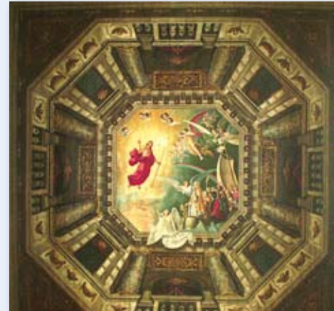
■ Soffitto del presbiterio

Quadrature prospettiche a finte architetture opera del 1620 del bresciano Tommaso Sandrini con scene centrali ridipinte da Demetrio Alpago nel 1902.