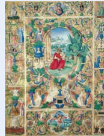
■ Salterio, Parigi Musée Marmottan