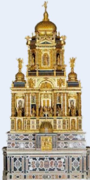
■ Altere del SS. Sacramento ora altare maggiore.