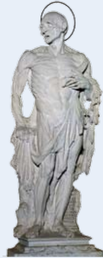
■ San Bartolomeo